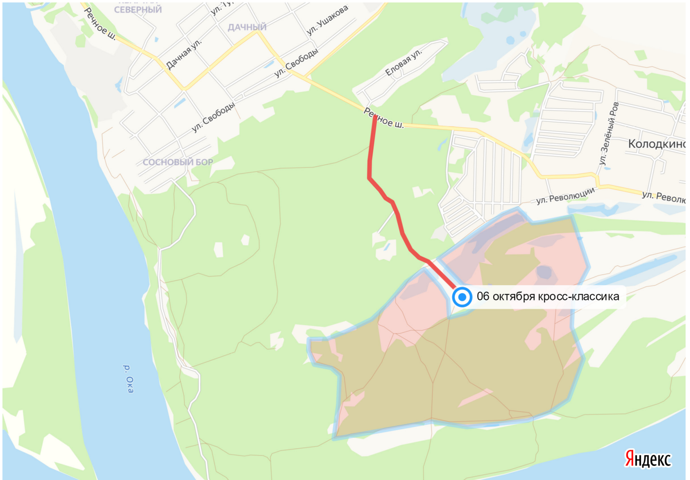
Схема арены 06 октября. Кросс-классика.